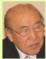
滝澤 行雄氏 秋田大学名誉教授