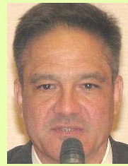
ジョン・ゴントナー氏 日本酒ジャーナリスト