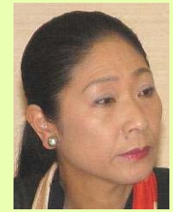
高橋 竹山氏 津軽三味線演奏家