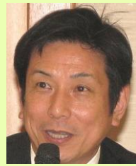
桂 米團治氏 落語家