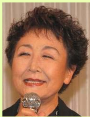
加藤 登紀子氏 歌手