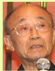
山折 哲雄氏 宗教学者