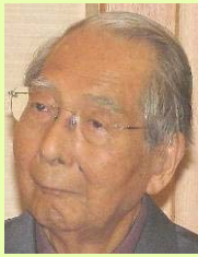
塩川 正十郎氏 東洋大学総長