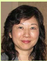
野田 聖子氏 日本酒を愛する女性議員 の会会長